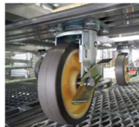
●中央 旋回ストッパー(首振り固定)