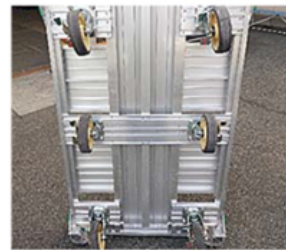
●旋回ストッパーはロック解除で 自在キャスターになります。 ●前へも横へも自由に移動。