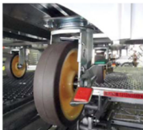
●四隅 回転ストッパー(ブレーキ)