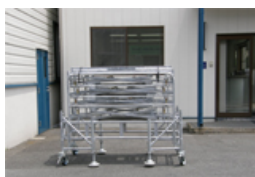
最初はとてもコンパクト