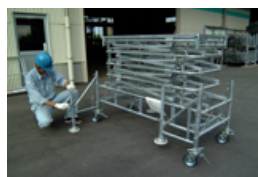
アウトリガーを設置して