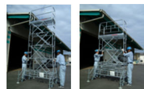
バネバランスで楽々作業